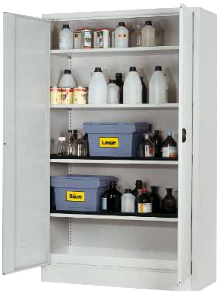
Photo : C.197.120/41000 Armoire chimique avec 4 étagère et 1 bac de rétention au sol en acier revêtement époxy (bacs de rétention en polyéthylène pour étagère et box pour produits chimiques en option)