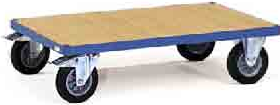
2590 | 2591 | 2592 | 2593 Platform