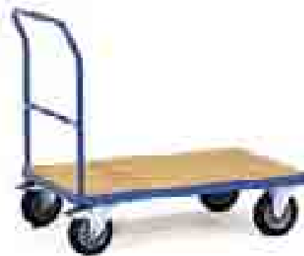
2500 | 2501 | 2502 | 2503 Open duwbeugel