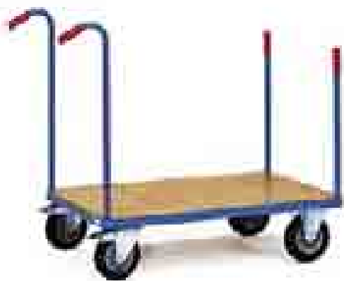
2580 | 2581 | 2582 | 2583 Rongenwagen

Laadvlakhoogte: Massief rubber 160 Ø = 225 mm, Massief rubber 200 Ø = 270 mm, Lucht 220 Ø = 285 mm.