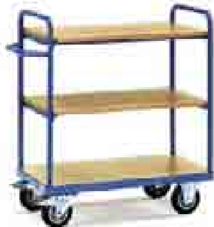
8100 | 8101 | 8102 | 8103