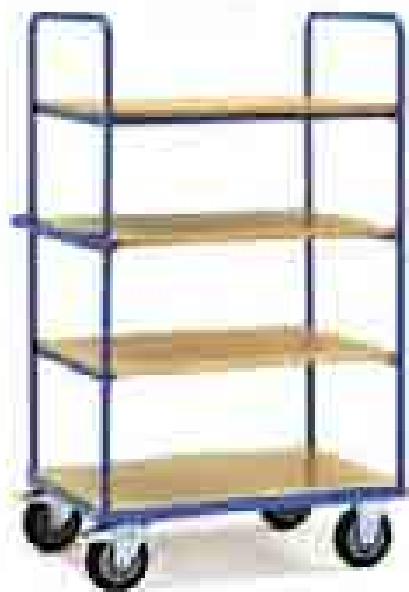
8301 | 8302 | 8303