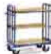
8110 | 8111 | 8112 | 8113