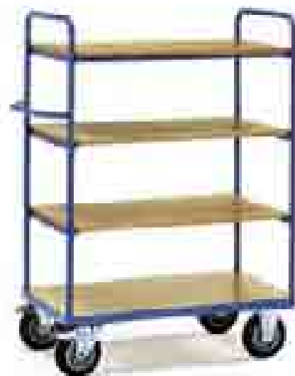
8200 | 8201 | 8202 | 8203