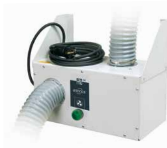
Ventilatie-unit voor bevestiging op de muur zonder flowbewaking Bestelnr. 14-1002 ■