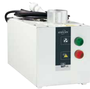
Ventilatie-opzetunit met flowbewaking Bestelnr. 14-1003 ■