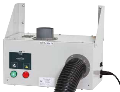
Ventilatie-unit voor onderbouwkasten, voor bevestiging op de muur, met flowbewaking en potentiaalvrij alarmcontact Bestelnr. 14-1026 ■