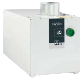
Ventilatie-opzetunit zonder flowbewaking Bestelnr. 14-1001 ■