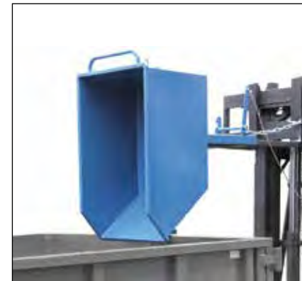
Kiepbak met vorkheftruck