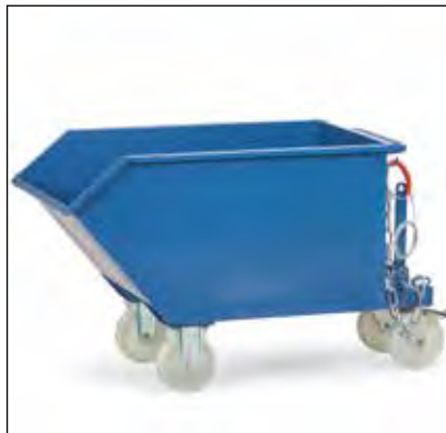
Kiepbak uitgevoerd met wielen